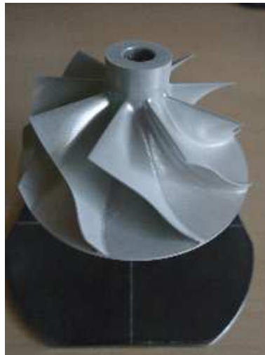
Abb. 2: mit ReflexEx