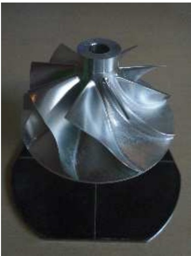
Abb. 1: ohne ReflexEx