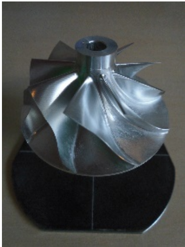
Abb. 1: ohne ReflexEx